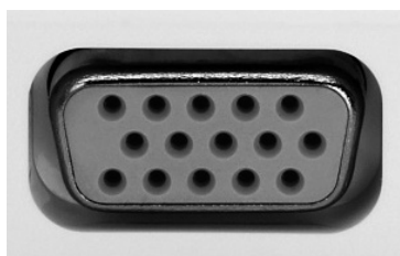
Mini D-sub 15ピン端子形状